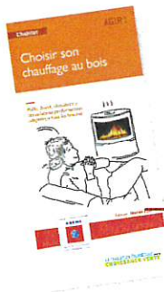
Guide ADEME « choisir son chauffage au bois »

Le secteur résidentiel est le premier émetteur de particules fines en Île-de-France (33 % de l'ensemble des PM 10 et 47% des PM 2,5 ) ; le chauffage au bois, utilisé par 800 000 foyers en Ile-de-France 2 , en est le principal responsable. Les conditions dans lesquelles la combustion du bois se fait ont un impact important sur la quantité de polluants émise et sur la quantité de bois consommé ; en veillant à respecter chacune de ces recommandations, vous limiterez les émissions de particules, vous chaufferez plus et avec moins de bois (meilleur rendement) :