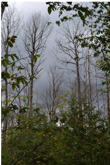
Image de châtaigniers atteints de la maladie de l'encre

Il n'y a pas de traitement pour lutter contre cette maladie.