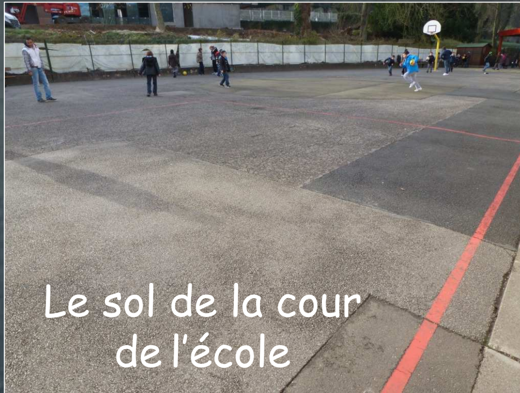
Le sol de la cour de l'école