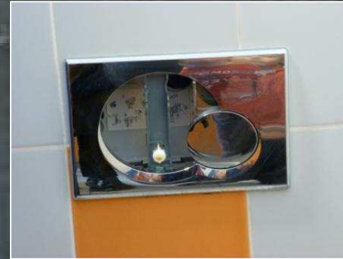
Les toilettes des garçons