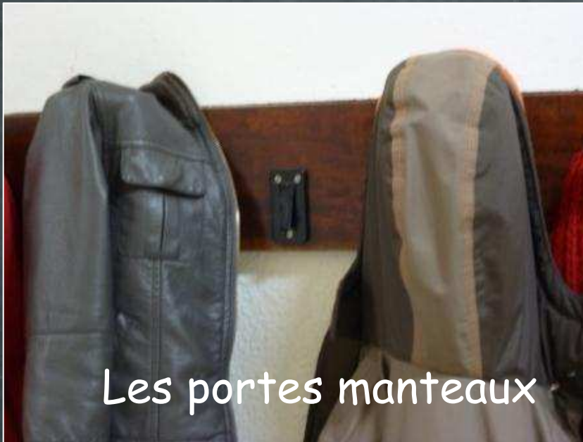
Les portes manteaux