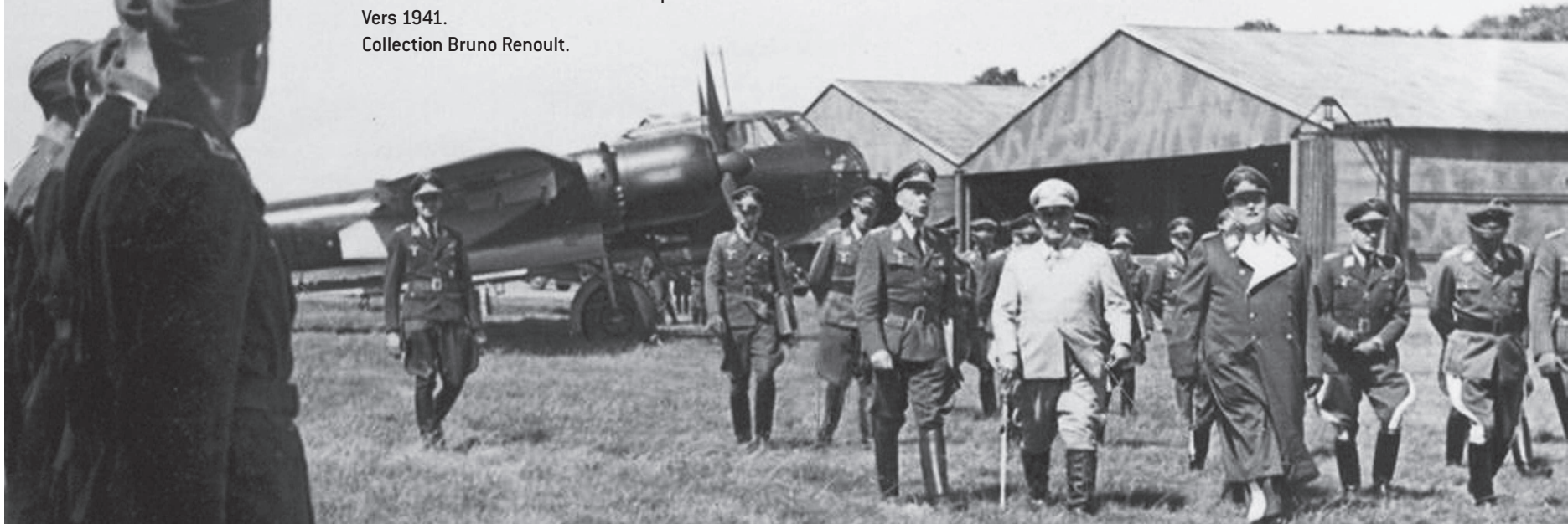
Visite par le Maréchal Hermann Goering de l'aéroparc occupé, entourée de mesures de sécurité importantes. Vers 1941.