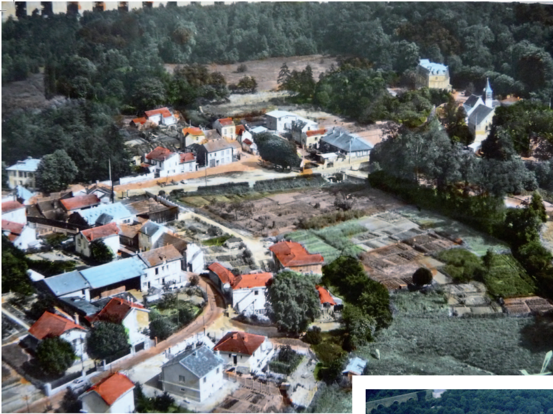
Pré Saint-Jean et ses alentours [arcades, château de la Sauvegarde, église, mairie, place de la République, villa des Sources, quartier des Marais...]. Vers 1960 et années 1980.